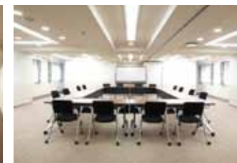
■ゴールデンルーム