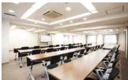
■ゴールデンルーム