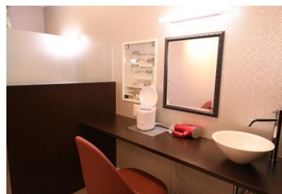
▲ゆったりとしたカウンター席