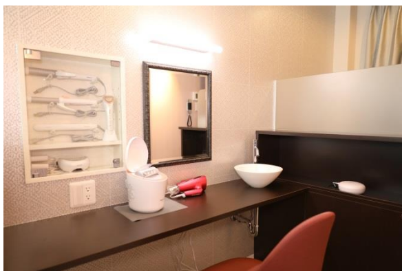
▲セルフエステが楽しめる空間「Be-Lounge®」

JR西日本グループでは、中期経営計画において、生活関連サービス事業を拡大し、快適なくらしの実現をサポートすることを重点戦略の1つとして掲げ、宿泊特化型ホテルの出店拡大を通じて、沿線外・エリア外を含めた市中への積極展開を進めています。ヴィアイン飯田橋後楽園の新規開業により、ヴィアインホテルチェーンは、全22棟、総客室数約5,200室となります。今後も「お帰りなさいのおもてなし」「爽やかな一日のはじまり」「徹底的に便利」をコンセプトに、国内外を問わず、ご利用いただくすべてのお客様に、ブランドシンボル「MY HOME HOTEL. (目指したのは自宅のくつろぎ)」をより感じていただけるホテルづくりを進めてまいります。